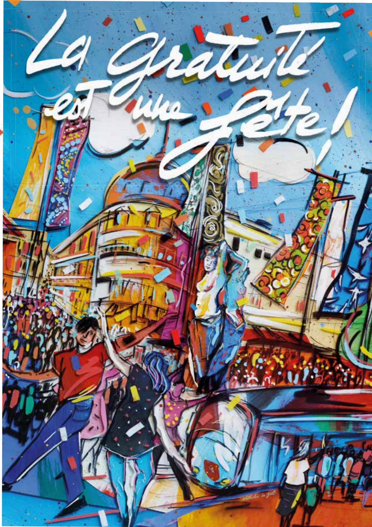
Illustration : Nathalie Le Gall

Montpellier Méditerranée Métropole - Direction de la Communication - 11/2023